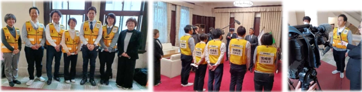
歩 鞞 に 応 ず の 庶 務