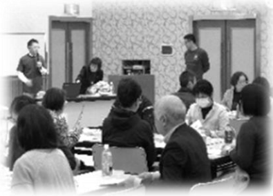
グループディスカッションの様子