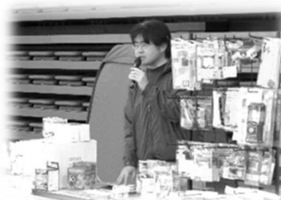
防災グッズの展示