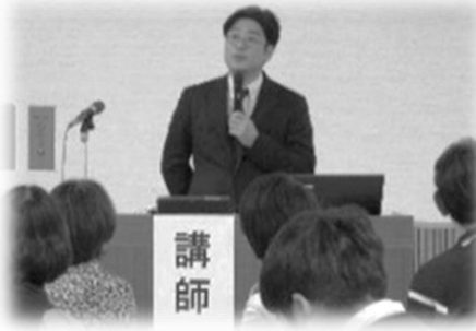
災害支援関連研修会