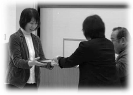
基礎研修Ⅲ修了証贈呈式