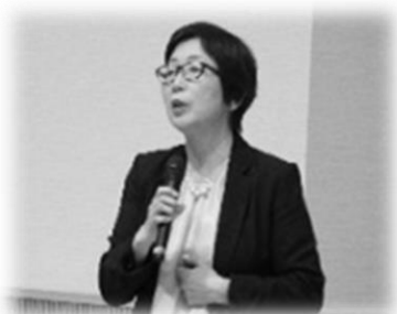
県福祉保健課長ご挨拶

また、研修会に関連した防災グッズの展示や子育て世代を応援する託児所の開設など、様々な新しい取り組みも実施いたしました。